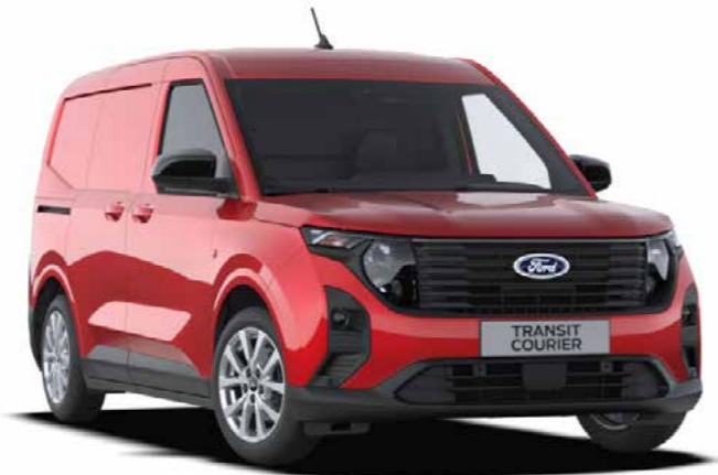
Fantastic Red metallic lak