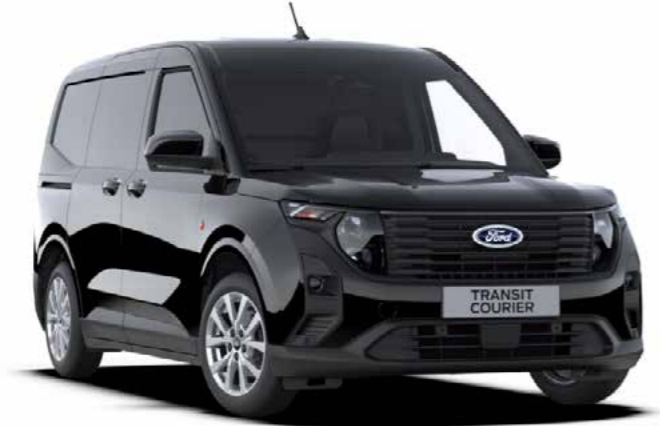
Agate Black metallic lak