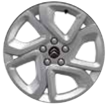
Lichtmetaal 17" ELLIPSE 215/65 R17