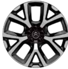
Lichtmetaal 19" ART 205/55 R19