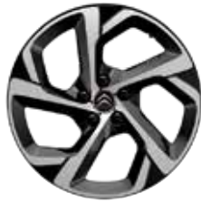
Lichtmetaal 18" SWIRL 225/55 R18