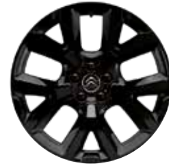
Lichtmetaal 19" ART Black 205/55 R19